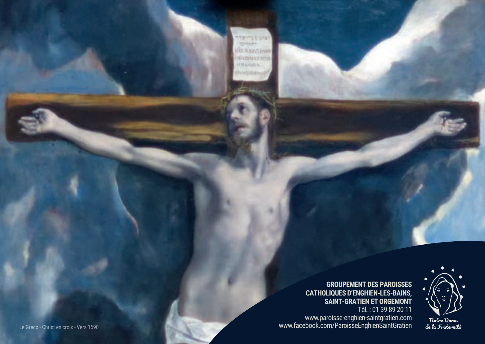
Le Greco - Christ en croix - Vers 1590

GROUPEMENT DES PAROISSES CATHOLIQUES D'ENGHIEN-LES-BAINS, SAINT-GRATIEN ET ORGEMONT