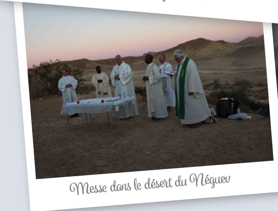
Messe dans le désert du Néguev