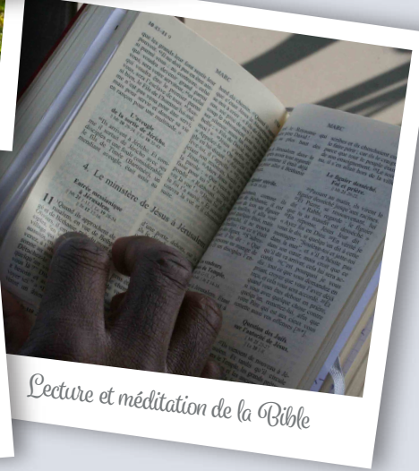
Lecture et méditation de la Bible