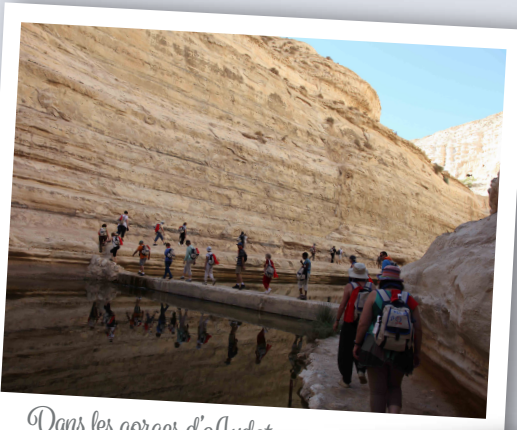
Dans les gorges d'Avdat