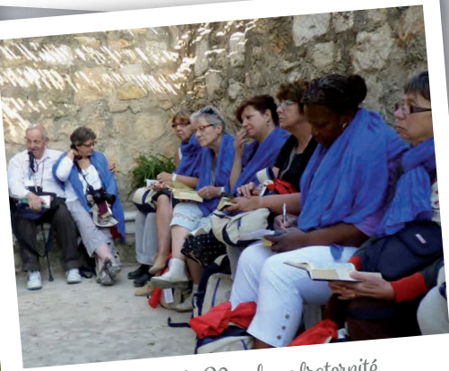
Partage de la Parole en fraternité