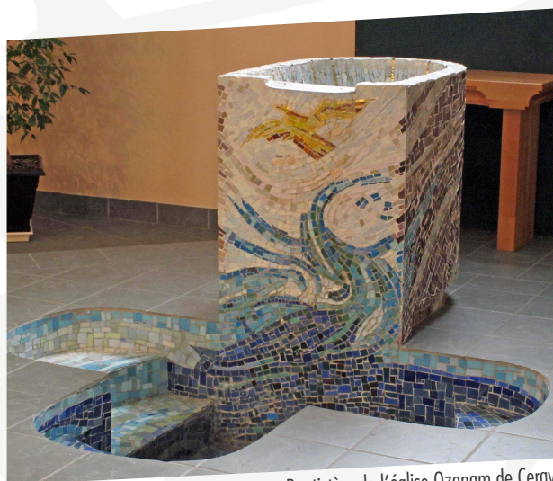
Baptistère de l'église Ozanam de Cergy