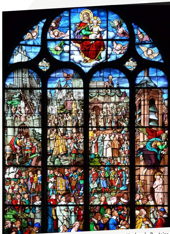
Vitrail de la cathédrale Saint-Maclou de Pontoise, « le vœu de la ville à Notre Dame de Pontoise » Didron - XIX e siècle