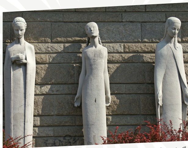
"Allégories féminines des trois vertus théologales", église de Goussainville, œuvre de Anne-Marie Roux-Colas, sculpteur.

Elle facilite les relations, lorsque c'est nécessaire, en servant d'intermédiaire entre l'affectataire, le propriétaire et les différents acteurs culturels.