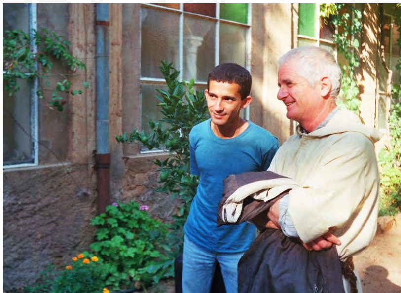
Père Célestin et un ami

Chaque jour ainsi nous sommes appelés à renouveler le oui de la confiance. « Sois sans crainte, petit troupeau, il a plu à votre Père de vous donner le Royaume » (Lc 12,32). La joie de notre Église est celle des béatitudes. Sur la route de la sainteté, le Saint Père dans son Exhortation nous donne un guide : les béatitudes. « Être pauvre de cœur, c'est cela la sainteté ! » ; « Réagir avec une humble douceur, c'est cela la sainteté ! » ; « Savoir pleurer avec les autres, c'est cela la sainteté ! » Cependant nous avertit le pape, « nous ne pouvons vivre cela que si l'Esprit Saint nous envahit avec toute sa puissance et nous libère de la faiblesse de l'égoïsme, du confort, de l'orgueil. » Mais quel chemin de joie ! Cette joie, signe du Royaume, nous la contemplons aussi chez nos frères et sœurs de la porte d'à-côté.