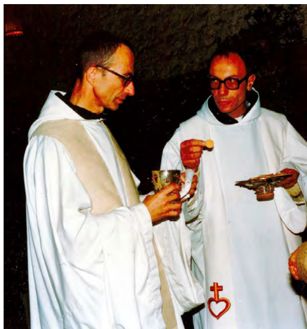
Père Christian de Chergé

Notre petite Église vit un moment de plus grande fragilité. Mais le don de la Béatification de nos frères et sœurs nous rappelle que nous vivons un temps de grâce. Ils nous ont été pris alors que nous aurions tellement aimé les avoir aujourd'hui avec nous. Mais ils sont avec nous. Et la fécondité de leur sacrifice, nous en aurons un signe lors de la célébration. Nos frères et sœurs musulmans vont à leur manière honorer les 114 imams qui ont refusé de cautionner la violence, sachant eux aussi qu'ils mettaient leur vie en danger. Ce sera l'occasion de penser à tous les autres si nombreux, journalistes, artistes, écrivains, intellectuels, modestes pères et mères de famille qui sont restés fidèles à leur conscience et à leur foi. Dans cette foi, il y a l'invocation si souvent répétée au Dieu Clément et Miséricordieux. Pour nous c'est Jésus qui nous a révélés le cœur Miséricordieux du Père.